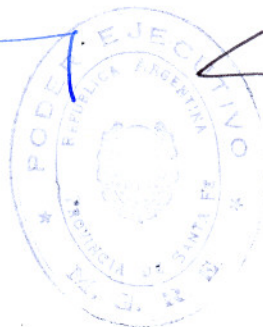
HERTES JUAN BINNER GOBERNADOR DE SANTA FE